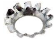
แหวนจักรเตเปอร์ CW